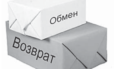
Купил жене в магазине зарядное устройство для мобильного телефона, на следующий день оно сошло. Как вернуть деньги или обменять товар? К сожалению, чек я при покупке не взял, но на коробке есть ценник с названием магазина, товара, ценой и серийным номером.