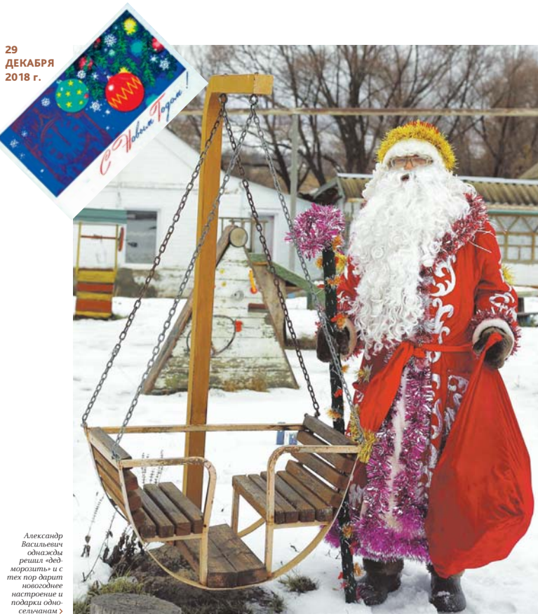
Александр Васильевич однажды решил «дедморозить» и с тех пор дарит новогодние настроения и подарки односельчанам