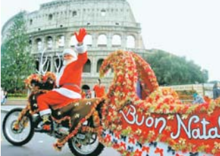
Итальянцы в предновогоднюю ночь выбрасывают старый хлам из окон

Не во всех странах Новый год встречают 1 января. В Японии, например, празднуют начиная 25 декабря и делают это почти семь. Местные жители украшают свои дома бамбуком, веточками сливы и ели, утопают друг друга белыми и розовыми рисовыми лепешками. О наступлении Нового года возвещают 108 ударов колокола. Мьянма отмечает с 12 по 17 апреля. Прохожие поливают водой из шлангов и ведр. Молодёжь моет старикам головы шампунем, изготовленным из кори и бобов.