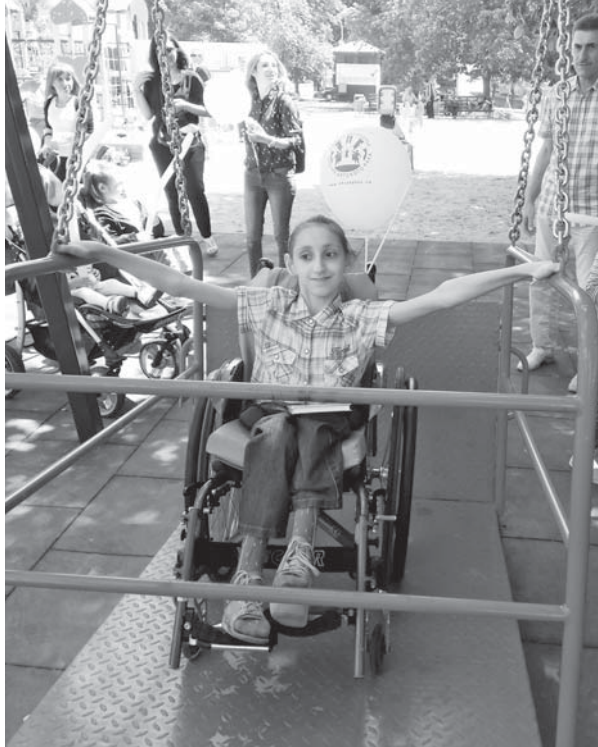
«Ребёнок с ограниченными возможностями сталкивается в обычном мире с препятствиями, о которых остальные даже не догадываются»

— Я бы в первую очередь сделала доступным белгородский Центр восстановительной медицины и реабилитации, —