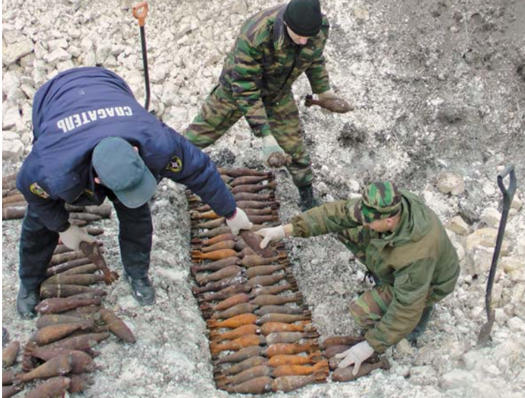
Сезон полевых работ — горячая пора для взрывотехников. Белгородская земля всё ещё полна опасными находками