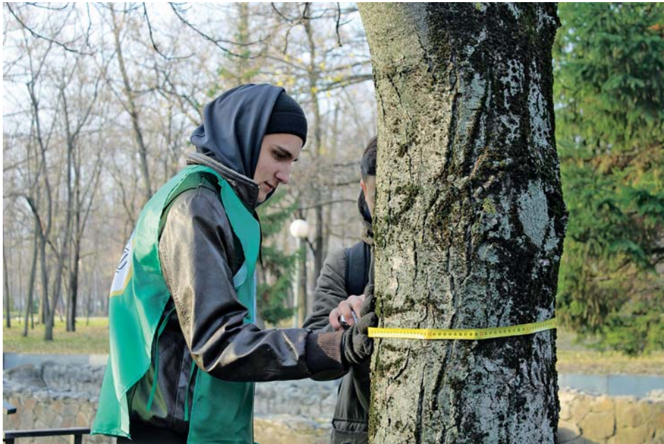
« Ответственный момент — измерение ствола дерева