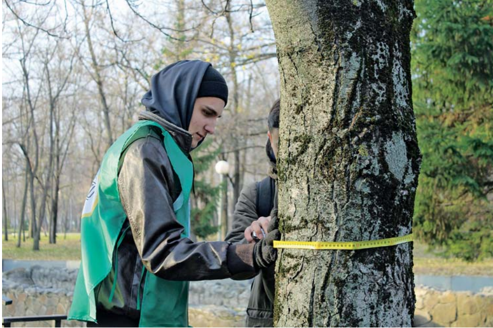
« Ответственный момент — измерение ствола дерева