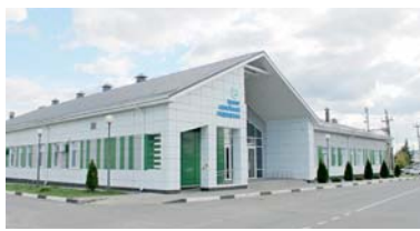
Шебекинский Центр семейной медицины пополнился ещё одним врачом

ВЛАСТЬ • ВЯЧЕСЛАВ ГЛАДКОВ ОЦЕНИЛ УСЛОВИЯ ПРЕБЫВАНИЯ МОБИЛИЗОВАННЫХ БЕЛГОРОДЦЕВ