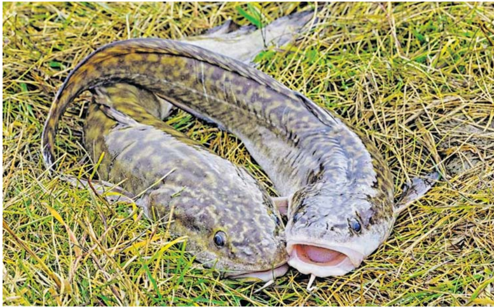
«Налим немного похож на сома»