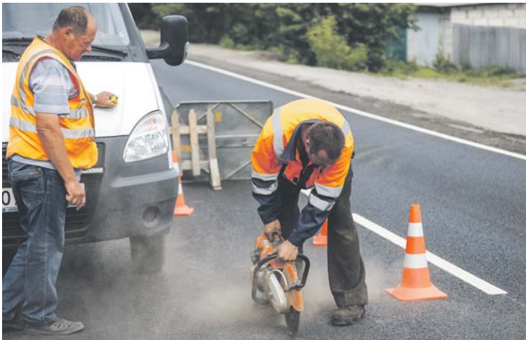
Рабочие «Гербы» берут образцы асфальта

Что нового появится в благоустройстве Белгорода? Облик каких зеленых зон изменится уже в этом году? На вопросы горожан отвечает глава администрации Белгорода Юрий Гадуля. Смотрите новый выпуск видеоблога «Про Белгород» в пятницу, 31 мая, в 15.20, 16.20, 19.00 и 20.30 в эфире первого областного и в любое удобное время — на интернет-ресурсах «Мира Белогорья»: сайте mirbelogorya.ru, канале «Мира Белогорья» на сервисе YouTube и в группах в соцсетях «Одноклассники», «ВКонтакте» и «Фейсбук».