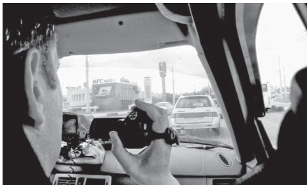
«Все нарушения фиксируются с помощью специальной прибора и видеокамеры»

Агрессия на дорогах, и сожаление, и уже давно никого не удивляет. Она не только в поведении водителей, беспрестанно сигнализирующих друг другу, выскакивающих из машины, но и в стиле вождения. Перестроиться без сигнала поворота, поджать, не пропустив соседа по дороге, — такое пренебрежение правилами приводит к печальным результатам. Для борьбы со злостными нарушителями в Белгородской Госавтоинспекции создали экипажи, работающие на машинах без специальных обозначений. Они сливаются с привычным транспортным потоком и оттуда наблюдают за водителями. Это называется скрытым контролем.