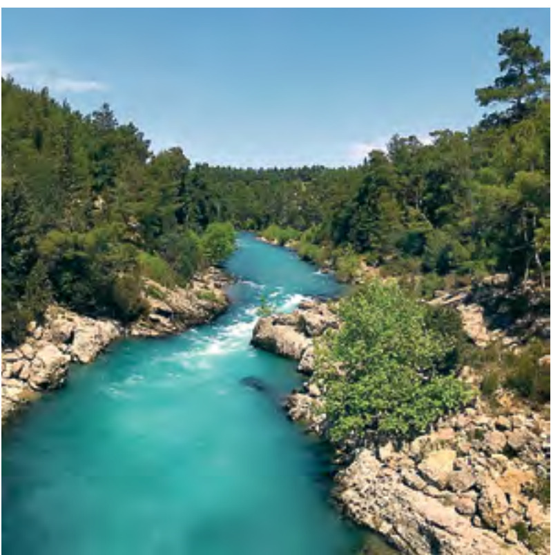
Горная река Кепручай

— Был и комендантский час: выйдешь после 11 из общежития — штраф. Одному ходит ночью небезопасно, особенно девушке. Кстати, если туристы опоздают на рейс, то