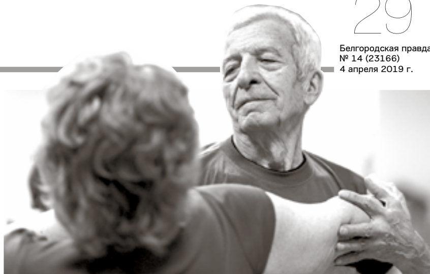
Танцую, чувствуешь себя молодым

Многолетнее наблюдение врачей показали, что определённые виды танцев эффективны как профилактика и один из способов лечения конкретных недугов. Так, например, танго – отличный помощник в лечении депрессии, болезни Альцгеймера и головных болей, фламенко полезно при остеохондрозе и заболеваниях суставов, латиноамериканские танцы отлично помогают скинуть лишний вес, а восточные стимулируют работу кишечника, увеличивают гибкость позвоночника. БП