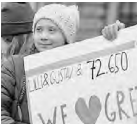
Шведская школьница Грета Турнберг во время митинга в Гамбурге 1 марта 2019 года

Кроме того, Грету Турнберг пригласили выступить на конференции ООН по вопросам климата и на Всемирном экономическом форуме в Давосе.