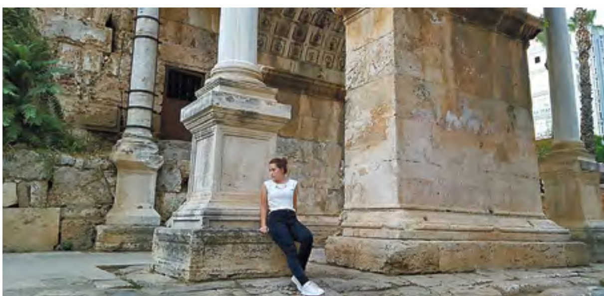
Ворота Адриана — одна из достопримечательностей Анталии

Трансферный гид встречает и провожает туристов, рассказывает, что можно делать и что нельзя. Некоторые люди в аэропорту плохо ориентируются, поэтому гидам приходится объяснять даже то, что обязательно нужно выложить металлические предметы из карманов