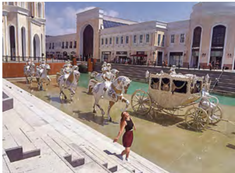
Отель The Land of Legends в Белеке