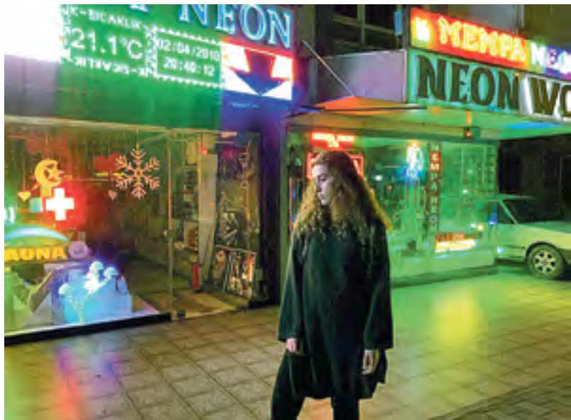
Центр Анталии ночью

ки, кровати, холодильник. Душ и туалет на комнату.