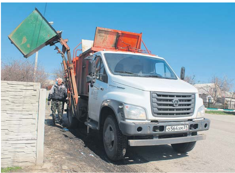
Новые машины прессуют мусор плотнее, поэтому выезжает больше.