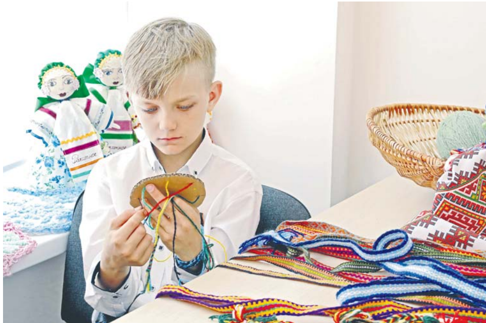
В новом центре каждый найдёт себе увлечение по душе

Оксана ПРИДВОРЕВА, Владимир ЮРЧЕНКО (фото)