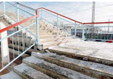
«Лестница перешла старая, но поощения»