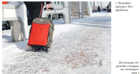
«Чемодан прошёл без проблем»