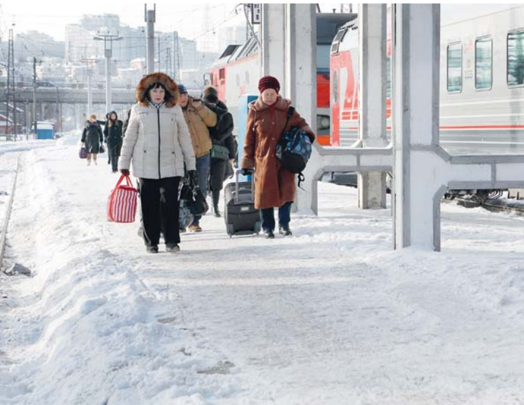
У края платформы снег остаётся, но он не мешает проходить

Проект «Старая школа» набирает обороты, пройдёт серия уроков красоты и грамотной русской речи. Задания для всех участников интерактивного проекта готовит народный артист России Виталий Стариков. Подключиться к процессу можно в любой момент: все видеоролики в свободном доступе на интернет-ресурсе «Мир Белогорья»: сайте mirbelogorya.ru, канале на YouTube и в группах в соцсетях «ВКонтакте», «Фейсбук» и «Одноклассники». Премьеру уроков посвящено тренировке голосовых связок, смотрите на первом абзаце или на сервисе «Яндекс.Эфир» в четверг, 31 января, в 15.20, 16.20, 19.00 и 20.30.