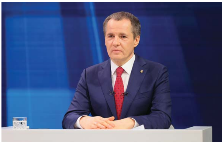
Во время прямой линии Вячеслав Гладков ответил на вопросы белгородцев, касавшиеся различных сфер жизни региона