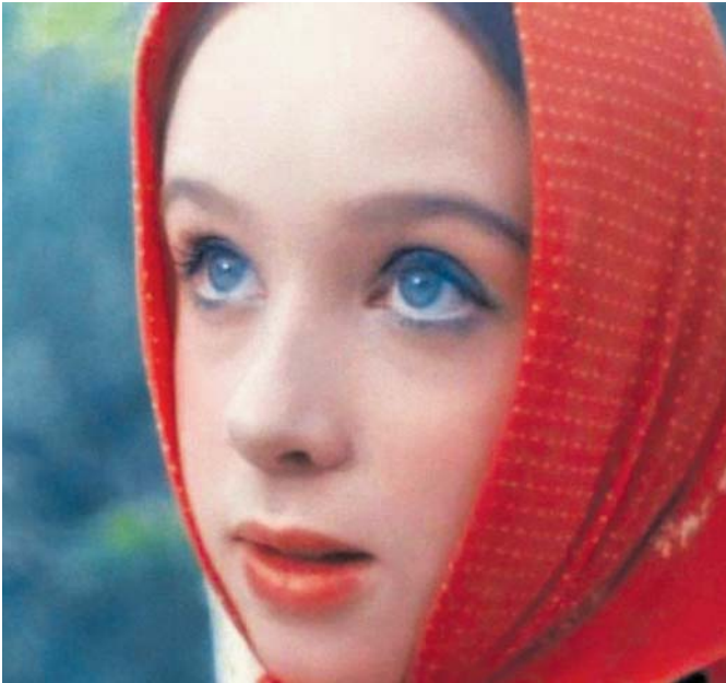
«Естественность красоты не портит (кадр из фильма «Морозко»)»