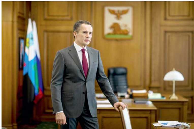
Вячеслав Gladkov за короткий срок стал одним из самых открытых губернаторов России