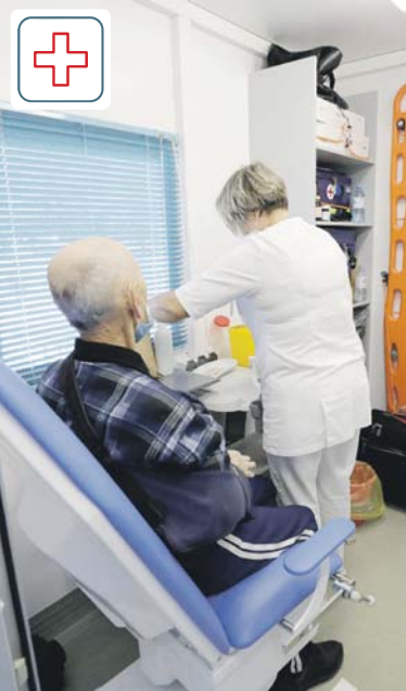
Основываясь на успешном опыте «поезда здоровья», в Белгородской области создадут четыре мобильных медицинских комплекса, которые будут курсировать по району»