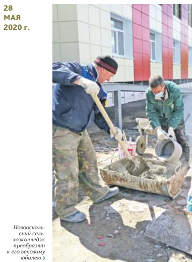
Новооскольский сельхозколхоз преобразит к его юбилею

КАЧЕСТВО ЖИЗНИ. В Шебекинском городском округе проведут капитальный ремонт Первоцеляевской школы. В одном блоке здания полностью завершили внутренние отделочные работы, заменили инженерные сети, частично — оконные блоки, отремонтировали кровлю. Строители приступили к облицовке фасада и устройству отделочного материала. Также проведут отделку пищеблока, зала хореографии, автового зала, начальной школы и детского сада, благоустроят прилегающую территорию. Работы завершат к концу августа.