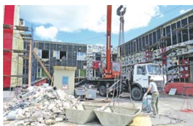
Строители обещают успеть в заявленные сроки