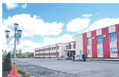
Голубинская школа дождётся капремонта