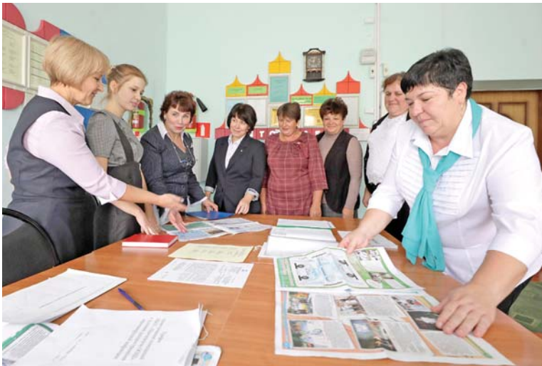
Педагоги Немецкой школы — мастера на все руки

В селе Весёлая Лопань Белгородского района открыли мемориальную доску памяти Василия Гетманского.