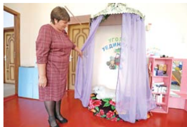
В школе оборудовали уголок ученика

МЫ, УЧИТЕЛЯ, ПРИВЫКЛИ К ТОМУ, ЧТО ДЛЯ НАС НЕТ СФЕР, КОТОРЫЕ НЕЛЬЗЯ ОСВОИТЬ, ЕСЛИ ЭТО ТРЕБУЕТСЯ. КАЖЕТСЯ, ЕСЛИ НУЖНО БУДЕТ НАУЧИТЬСЯ БАЛЕТУ, МЫ ЗА НОЧЬ ОСИЛИЛИ И ЭТО НЕПРОСТОЕ ДЕЛО.