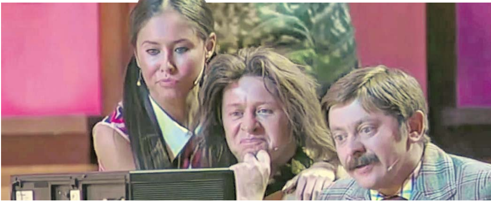
«Советская семья купила видеомагнитофон. Фрагмент шоу «Грильских пельменей»»