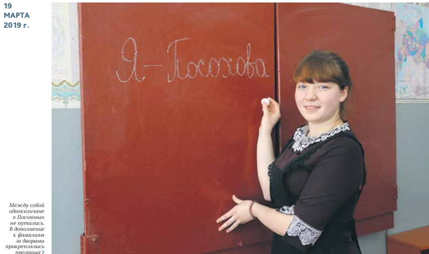
Между собой односельчане в Посоховых не путались. В дополнении к фамилиям за дворами прикреплялись прозвища.