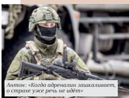
Антон: «Когда адреналин зашкаливает, от страха уже реч не идет»