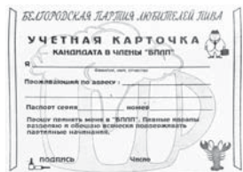
1 апреля 1994 года молодежная газета «Смена» объявила запись в белгородской партии любителей пива

КУЛЬТУРА • БЕЛГОРОДЦЫ СМОГУТ ОПРЕДЕЛИТЬ ЛУЧШИЕ ФИЛЬМЫ ОНЛАЙН-КИНОФЕСТИВАЛЯ «ДУБЛЬ ДВ@»