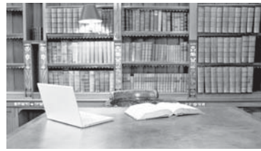
В запылившихся книгах заводится жучки»

Не всегда современная книга оказывается бестселлером. Прочетать годы, даже сотни лет, чтобы книга обрела ценность. Информацию о минувших днях ищем по крупицам: как было тогда, как говорили, как одевались, какая одежда была привычной для наших предков и многое другое.