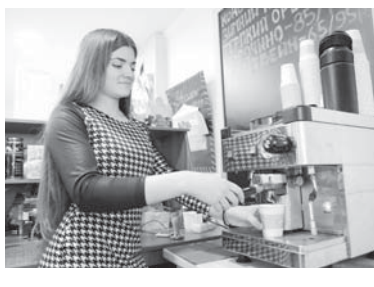
Автоматическая кофейная машина не даст напиток высокого качества

Главное — три основных правила: обеспечить качество напитка, обучить персонал и найти подходящее место для стойки.