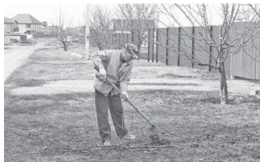
«Ветки, собранные в Белгороде и районе, свозят на полигон в Стрелецкое, где их сортируют и перерабатывают»

Узнать график вывоза растительных отходов можно в Центре экологической безопасности по телефону 8 (800) 200 75 19.