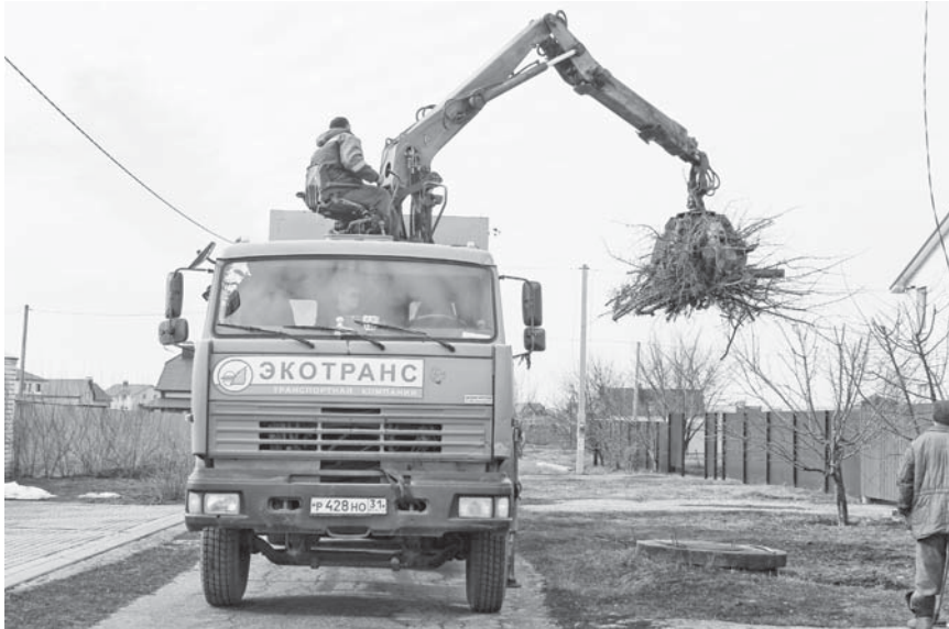
«Ветки оставляют на специальных площадках, созданных органами местного самоуправления, или напротив домов»