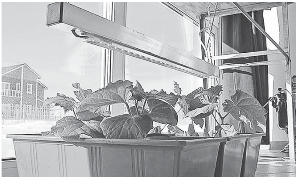
«Когда вы сами увидите такой результат, сомнений в эффективности фитоламп не останется»

Тропические комнатные растения и рассада, которую начинаем выращивать уже в феврале, при недостатке света не могут нормально развиваться. У комнатных растений листья мельчают, цветы опадают, а рассада вытягивается, часто болеет. Недостаток солнечного света напрямую связан с фотосинтезом. Помочь растениям могут фитолампы.