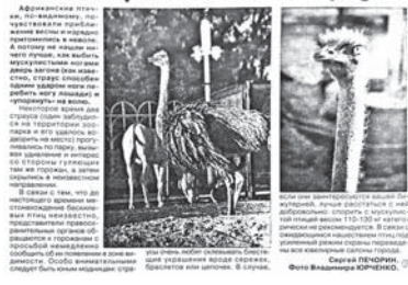
В 2006 году на свободу вырвался страус. «Смена» предупреждала: «Особо внимательными следует быть юным модницам: страусы очень любят склеивать блестящие украшения вроде серёжек, браслетов или цепочек».