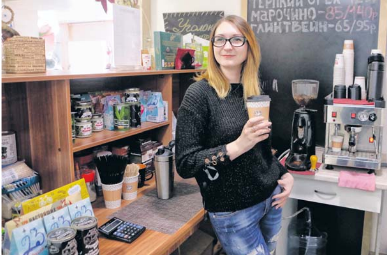
В день кофейной киоск приносил от 1,5 тыс. рублей

СВОЁ ДЕЛО • ИСТОРИЯ ОБ ОДНОМ НЕУДАВШЕМСЯ БИЗНЕСЕ