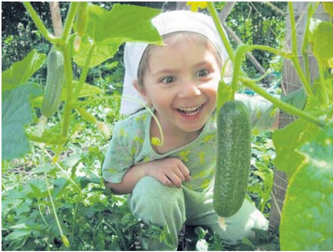
«Сочные хрустящие огурчики без горечи — дети уплетают с большим удовольствием»

Селекционеры долго ломали голову над причиной появления горечи. Исследования показали: в растениях семейства тыквенных вырабатывается вещество — кукурбитацин. Это токсическое соединение, но в малых дозах оно облада-