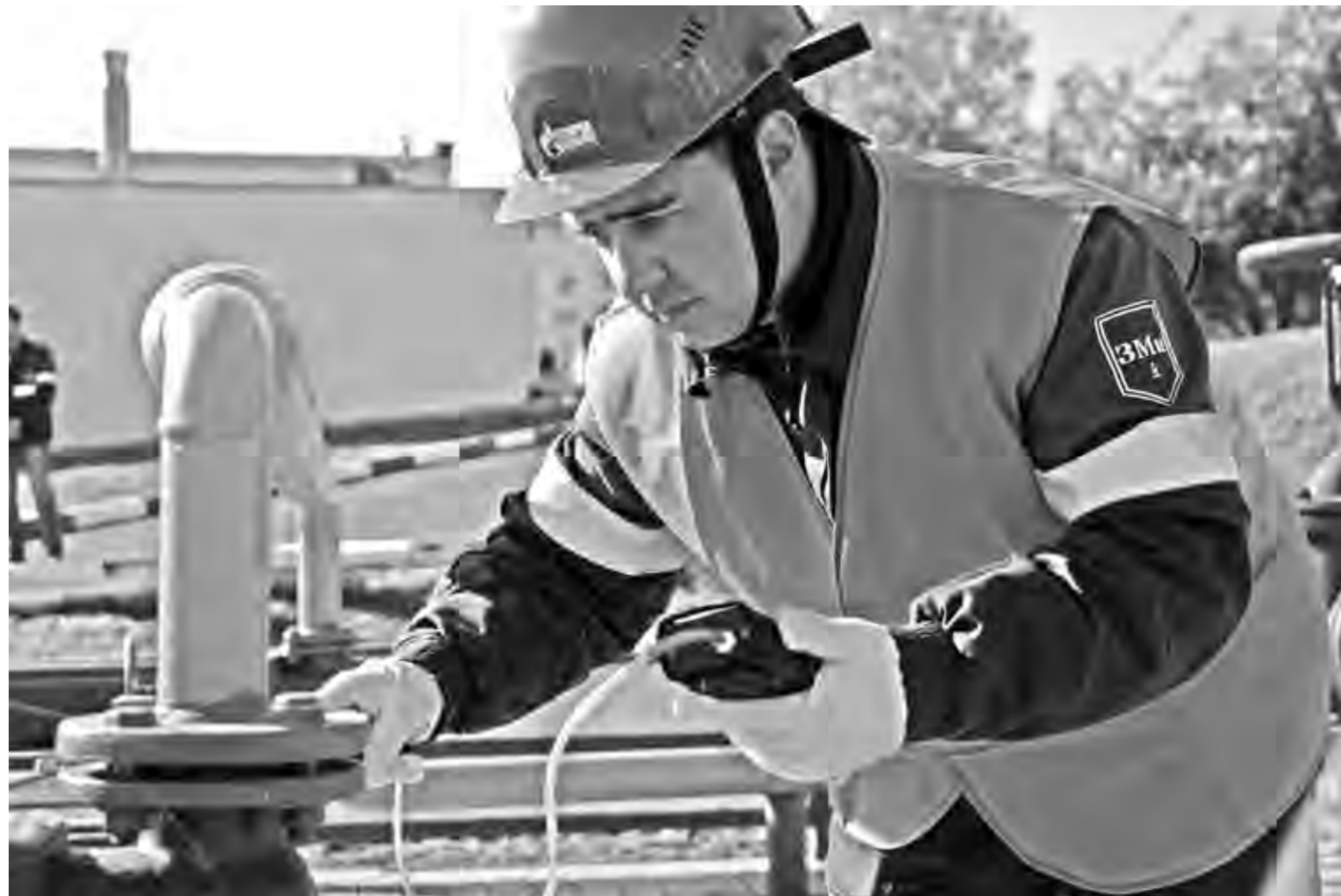
Специалисты АО «Газпром газораспределение Белгород» обеспечивают надёжную и безопасную работу газового оборудования

Обслуживание состоит в проверке соответствия установки газовых приборов нормативным требованиям, исправности кранов. Если надо, делается их разборка, чистка, смазка. Специалист проверит все соединения на герметичность, а при обнаружении утечки газа немедленно её устранит, прочистит горелки, регулирует горение газа на всех режимах работы. Он проверит работоспособность автоматики безопасности, проведёт необходимый инструктаж.