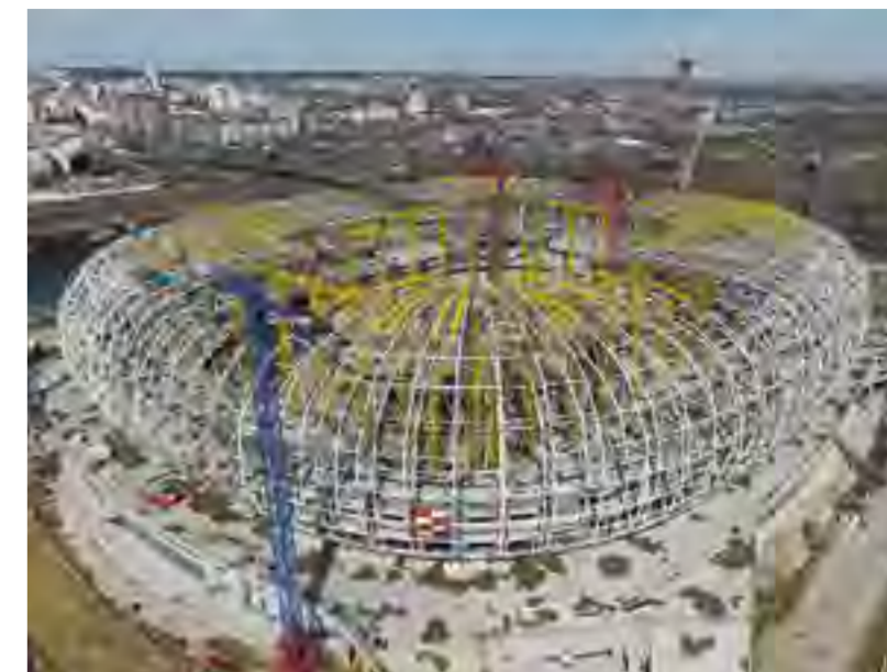
Монтаж металлоконструкций стадиона в Саранске