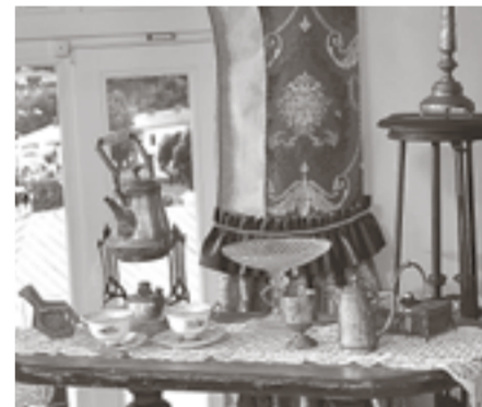
Посуда XIX века

евич Скорупский 20 сентября 1892 года на Гражданском проспекте (в то время Корочанской улице). Он обучался мастерству фотографии в Москве.