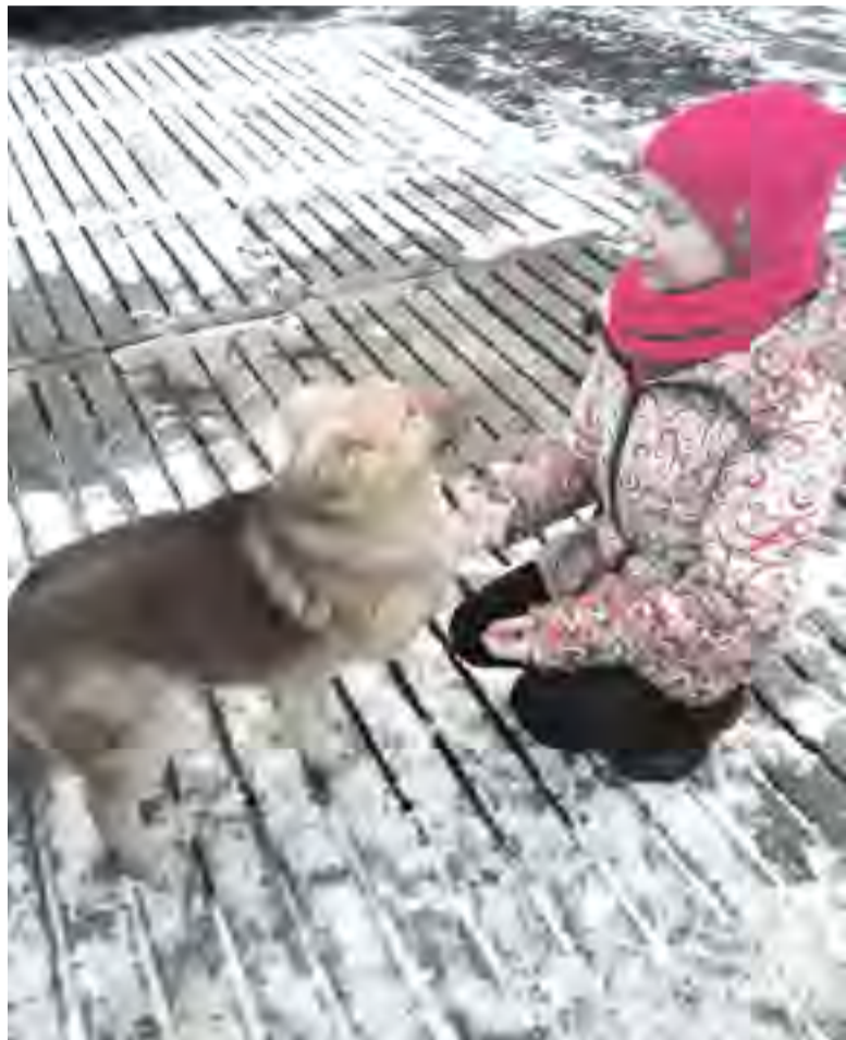
Дай лапу, друг!