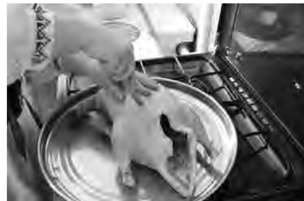
На тушке гуся делаем надрезы

Тушка гуся – примерно 4 кг; яблоки – 8–10 шт.; белое вино – 100 г; майонез – 1 ст. ложка; горчица – 2 ст. ложки; чеснок – 1 головка; соль, перец, приправа для мяса и зелень – по вкусу.