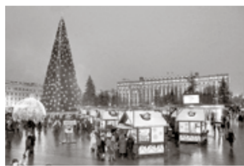
Парад Дедов Морозов и праздник на Соборной площади

ПРАЗДНИК В субботу, 22 декабря в 15 часов я стояла на Гражданском проспекте рядом с длинной колонной Дедов Морозов, Снегурочек, Бабок-ёжек, Кикимор, скоморохов из школ, детских садов и организаций. Не менее популярны были костюмы зверей: там и тут мелькали белышьи ушки и волчьи зубы, сытые бока медведей и чистые носки свиной (куда ж без символа наступающего года?).