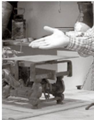
В лавке купца Пивоварова

ИСТОРИЯ Постоянная экспозиция «Уездный город» открыта в Белгородском музее народной культуры. Она заняла третий этаж здания на Гражданском проспекте конца XIX – начала XX века.