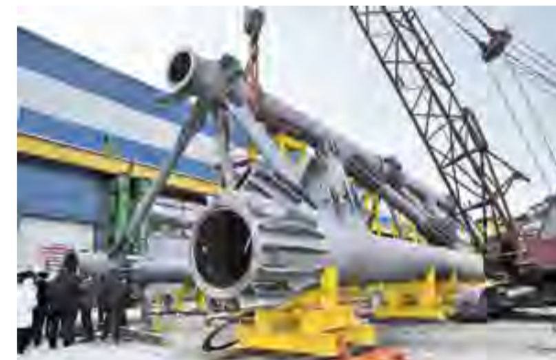
Контрольная сборка металлоконструкций стадиона Казань-Арена

Сейчас в стране огромное количество малых и средних предприятий, успешно выпускающих типовые металлоконструкции для строительной отрасли. Для нас это скучно и экономически не выгодно... Наш профиль – геометрически сложные, порой уникальные, конструкции для по-настоящему знаковых объектов