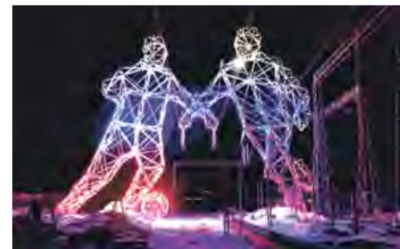
Опоры ЛЭП в виде футболистов на территории Пермской ГРЭС

За последние месяцы поставили конструкции для двух центров художественной гимнастики в Москве и Сочи. Оба сложной геометрии, один – в виде гимнастической ленточки. К Новому году будут закончены поставки для белгородского аквапарка «Лазурный». В работе ещё один уникальный объект для Сочи – центр одарённых детей. В наступающем году будут новые интересные объекты, они тоже станут страницами в славной истории завода «Энергомаш», которому в 2019 году исполнится 80 лет. БП