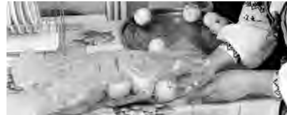
Помещаем гуся в рукав для запекания