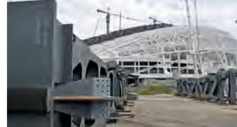
Металлоконструкции для главной спортивной арены олимпийского Сочи