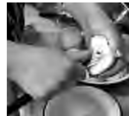
У яблок вырезаем серединку