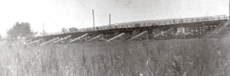
1964 год. Деревянный мост через реку Северский Донец