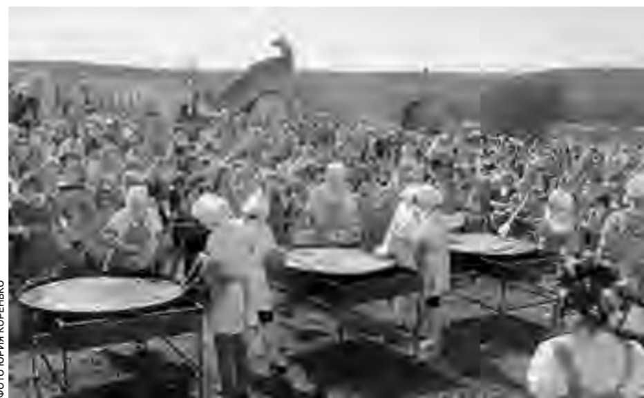
Фестиваль «Фомина яшица»

Кроме того, Белгородская область отменилась в национальном рейтинге туристических брендов. Регион представил на суд жюри заявки в трёх номинациях, и все они оказались в числе победителей. Так, в номинации «Региональные события» фестиваль «Белгородская черта» завоевал первое место. Белгородский динопарк занял второе