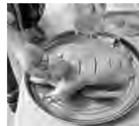
Натираем тушку специями