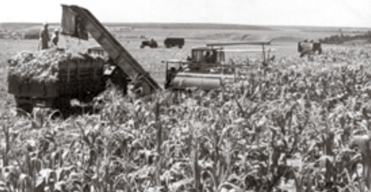
1964 год. Уборка кукурузы на силос в колхозе им. Ильича Борисовского района

★17 ЯНВАРЯ образовано областное управление по печати – «для обеспечения руководства полиграфией, книжной торговлей, охраной государственных и военных тайн в печати».