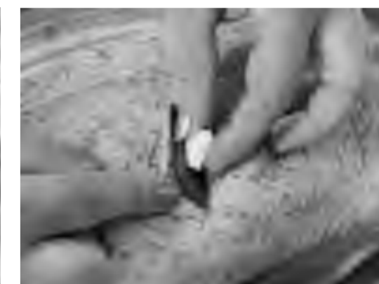
В каждый надрез закладываем дольку чеснока