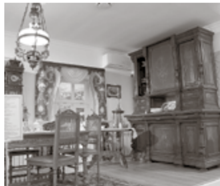
Мебель состоятельного белгородца