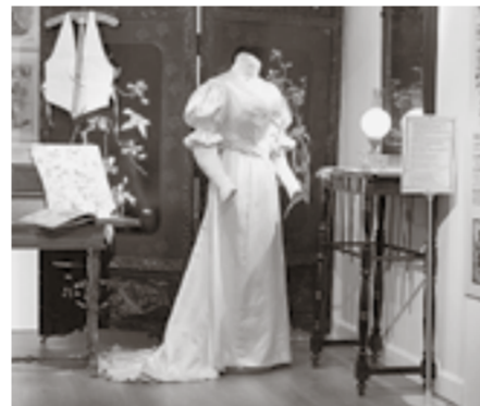
Свадебное платье XIX века