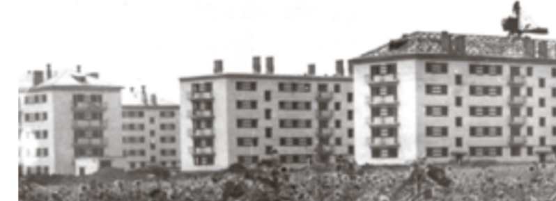
1964 год. Строительство 70-квартирных жилых домов в 3-м микрорайоне Белгорода

★В АВГУСТЕ в Белгороде, в пойме реки Везёлки между улицами Богдана Хмельницкого и Танкиста Полова начата планировка площадки будущего парка Победы.