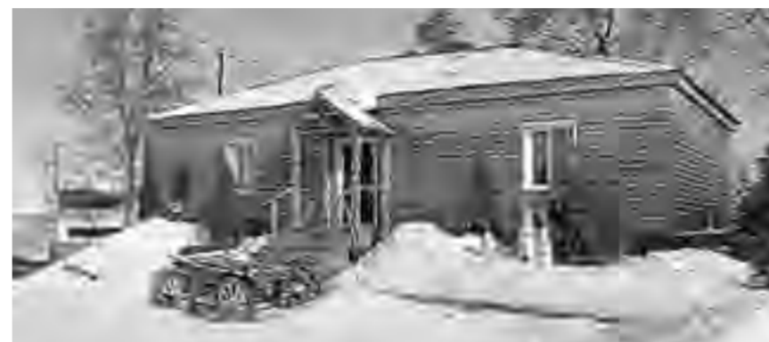
Музей в Нижней Покровке