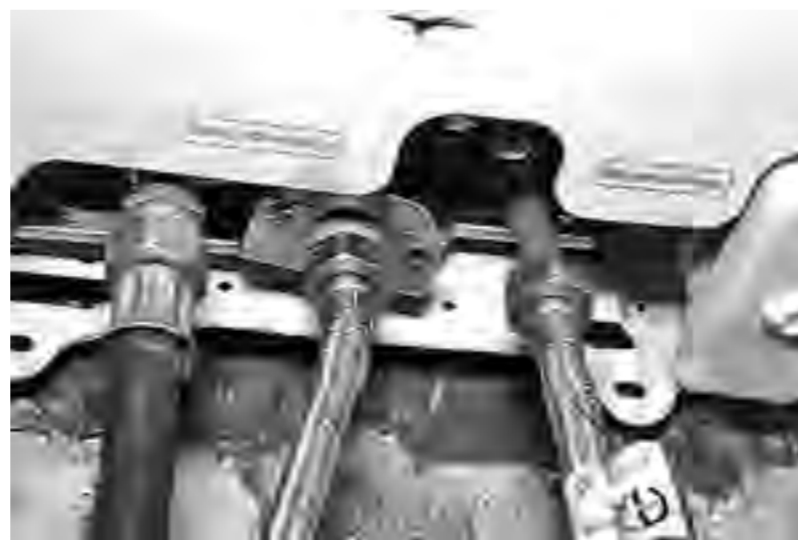
«Умелец» перепутал шланги воды и газа

Во избежание взрыва нельзя включать и выключать свет и электронагревательные приборы. Пользоваться газовым оборудованием можно только при открытой форточке.