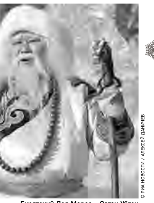
Бурятский Дед Мороз – Саган Убген

У каждого, в общем, свой Дед Мороз. И если задаться целью посетить их новогодние резиденции по всей России, на это уйдёт немало лет. Зато каждый Новый год будет непохож на предыдущий.