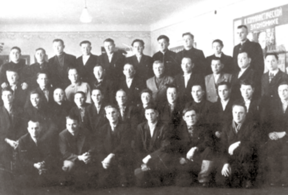
1964 год. Семинар бригадиров комплексных бригад Ракицкого района