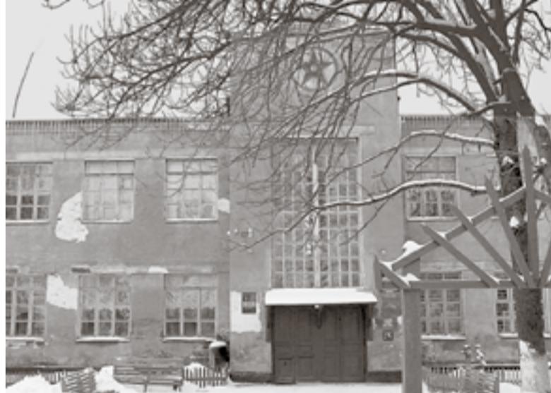
Школа в Дмитриевке, где гримировались профессиональные актёры