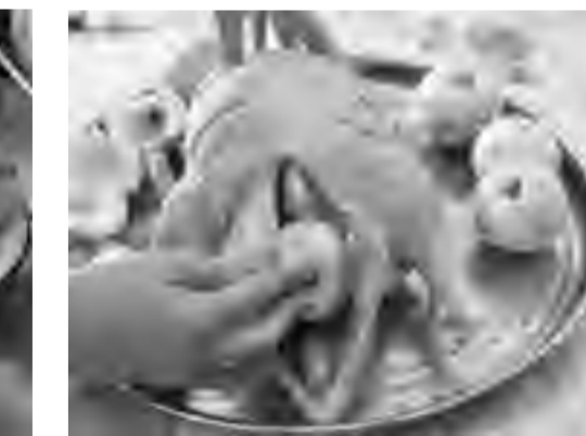
Начинаем тушку яблоками