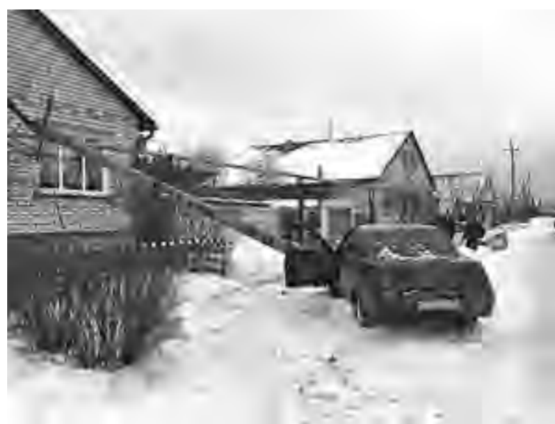
ДТП с повреждением газопровода

Нельзя оставлять без присмотра зажжённые газовые горелки, использовать газовые плиты для обогрева помещения. Но есть и то, что можно и даже нужно: проверять наличие тяги до и после розжига прибора. При обнаружении запаха газа необходимо немедленно прекратить его подачу к газовому оборудованию и сразу проветрить помещение.