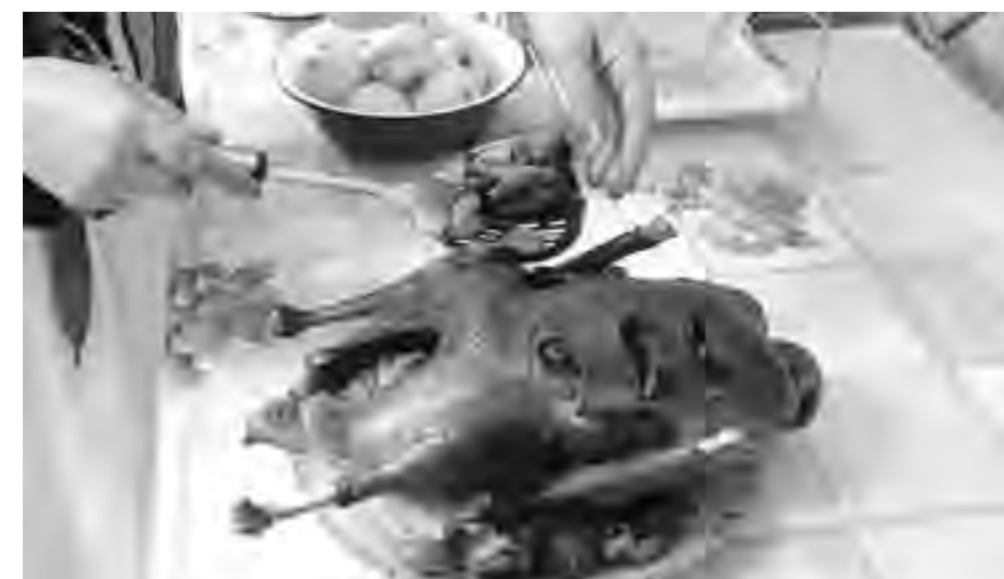
Готового гуся обкладываем печёными яблоками