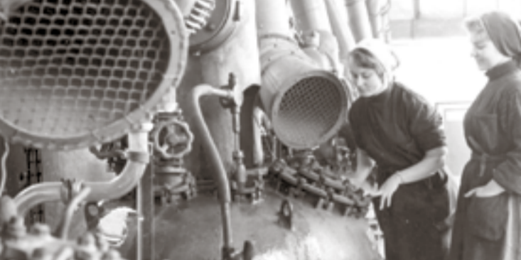
1964 год. Пусконаладочные работы в отделении технической аскорбиновой кислоты Белгородского витаминного комбината.