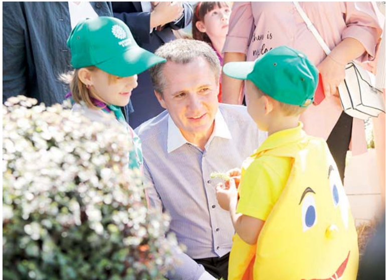
Вячеслав Гладков изменил привычный формат общения с жителями