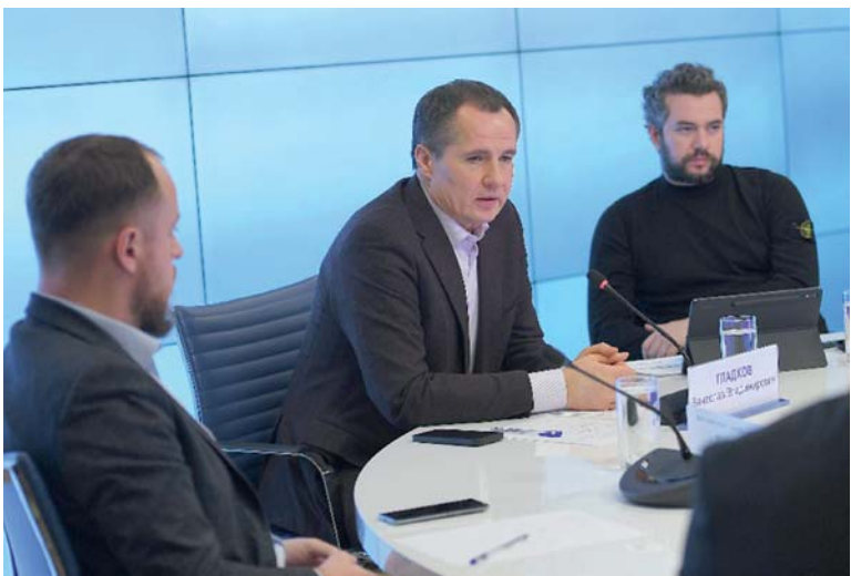
Вячеслав Гладков выбрал тактику быстрого реагирования на любой фейк и предоставляет примерную информацию >