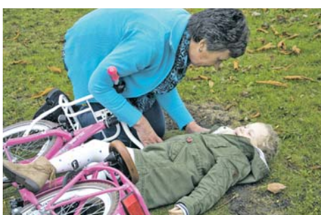
^ Самая уязвимая часть, которая чаще всего страдает — затылок