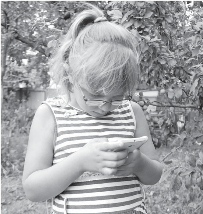
Маленькие часы не отвлекаются от гаджетов и соцсетей — это первые признаки зависимости

Маленькие часы не отвлекаются от гаджетов и соцсетей.