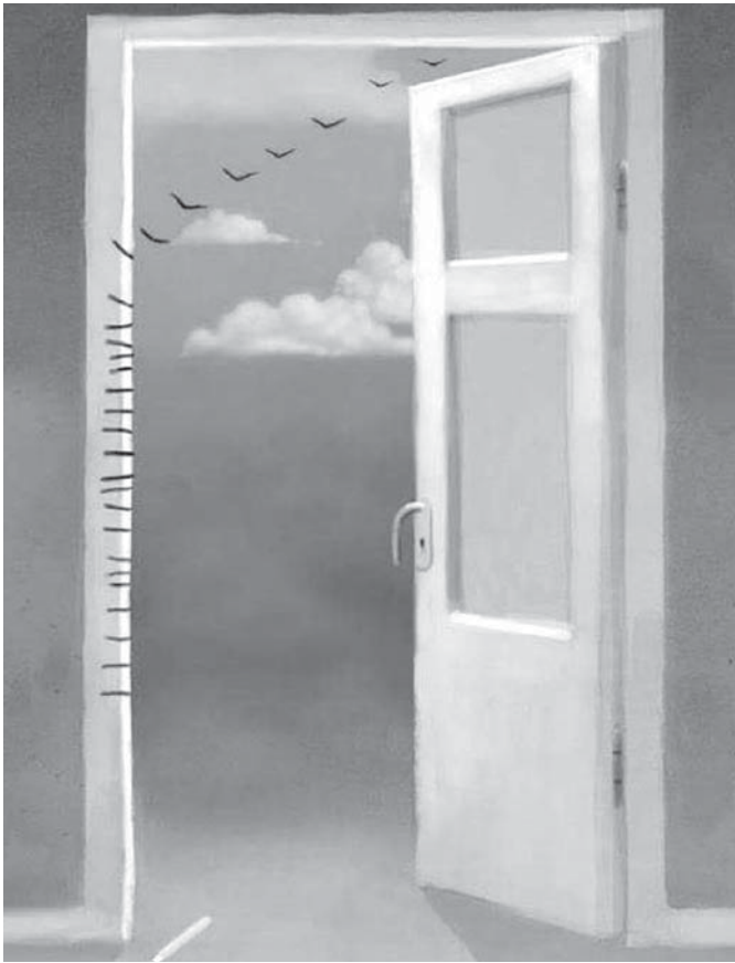
«Уход детей из родительского дома — ключевой этап в жизни семьи и начало новой главы в отношениях родителей»

СТРАДАЕТ ТОТ, КТО БОЛЬШЕ ВОВЛЕЧЁН В РОДИТЕЛЬСТВО. ЧАЩЕ ЭТОМУ ПОД- ВЕРЖЕНЫ ЖЕНЩИНЫ.