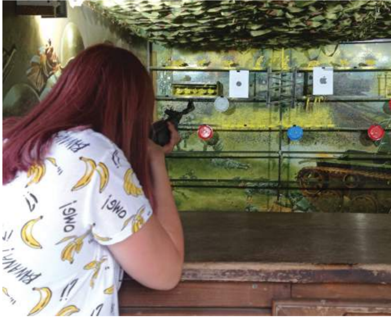
← Призовых тиров в городе много

Хотя в коммерческих объектах под названием «тиры» оружие тоже имеет свои нюансы. Арбалетам и пневматике может потребоваться лицензия, это зависит от мощности изделия.