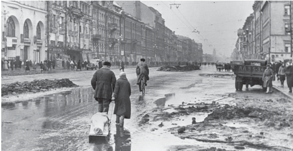
«Блокада. Жители Ленинграда везут тепло умиршего»