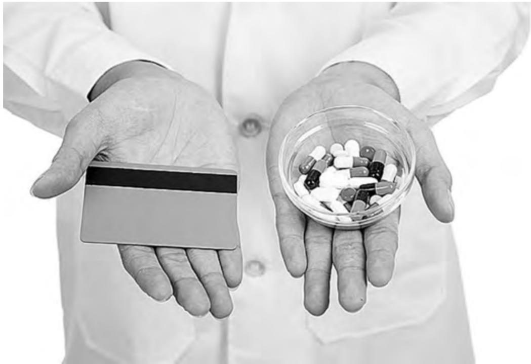
Список лекарств, по которым можно получить социальный налоговый вычет, будет изменён

Подготовила Оксана ПРИДВОРЕВА