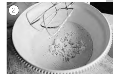
Добавляем перетёртый без комочков творог, взбиваем