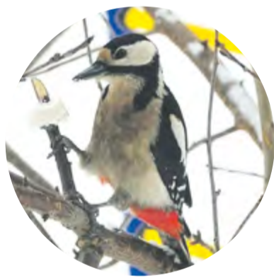
Большой пёстрый дятел