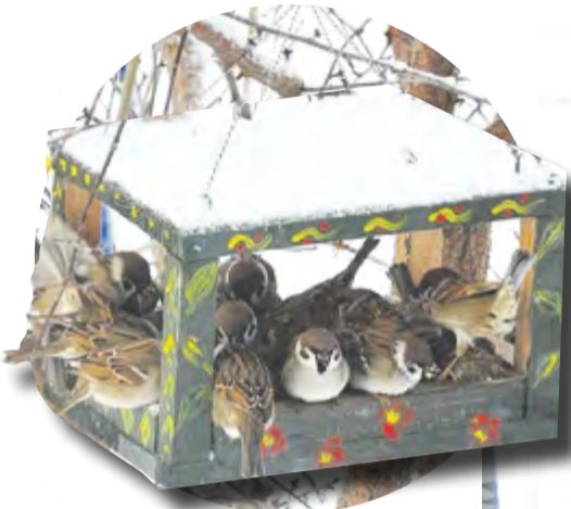
Воробьи прилетают кормиться шумной стайкой

Кормушка за окном открыла мир, который мы не замечали