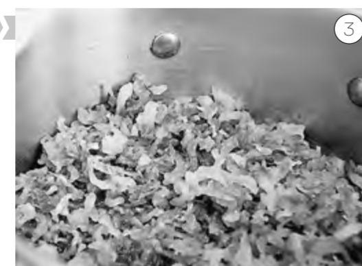
В течение двух часов обжариваем оставшуюся половину тёртой сырой свёклы, остужаем