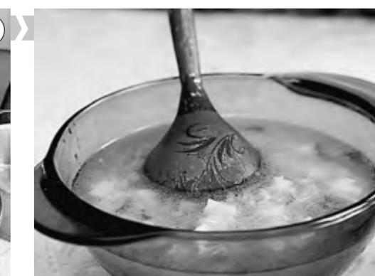
Зимняя окрошка готова