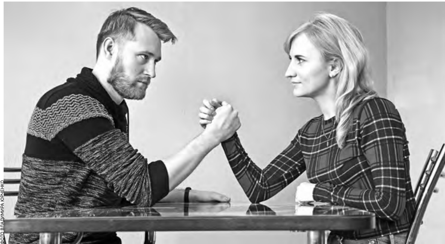
Долой эту дику привычку мериться с женщиной силой!

От хорошей жизни кричать не будешь. Но мне показалось, что, во-первых, движут нашими женщинами не конкретные тяготы, а понимание того, как сильно отличается их жизнь от международных гендерных тенденций. Мир сегодня открыт, и люди сравнивают ситуацию в собственном социуме с тем, как всё устроено в Западной Европе и США. Не секрет, что му-