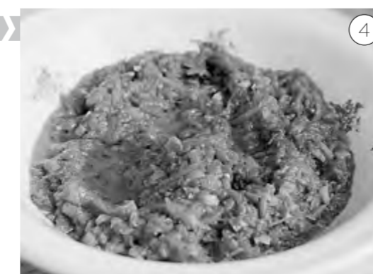
Обжариваем свёклу и морковь, добавляем томатную пасту, соль, остужаем