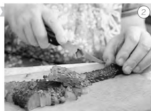
Картофель и огурцы нарезаем кубиками, кладем в бульон