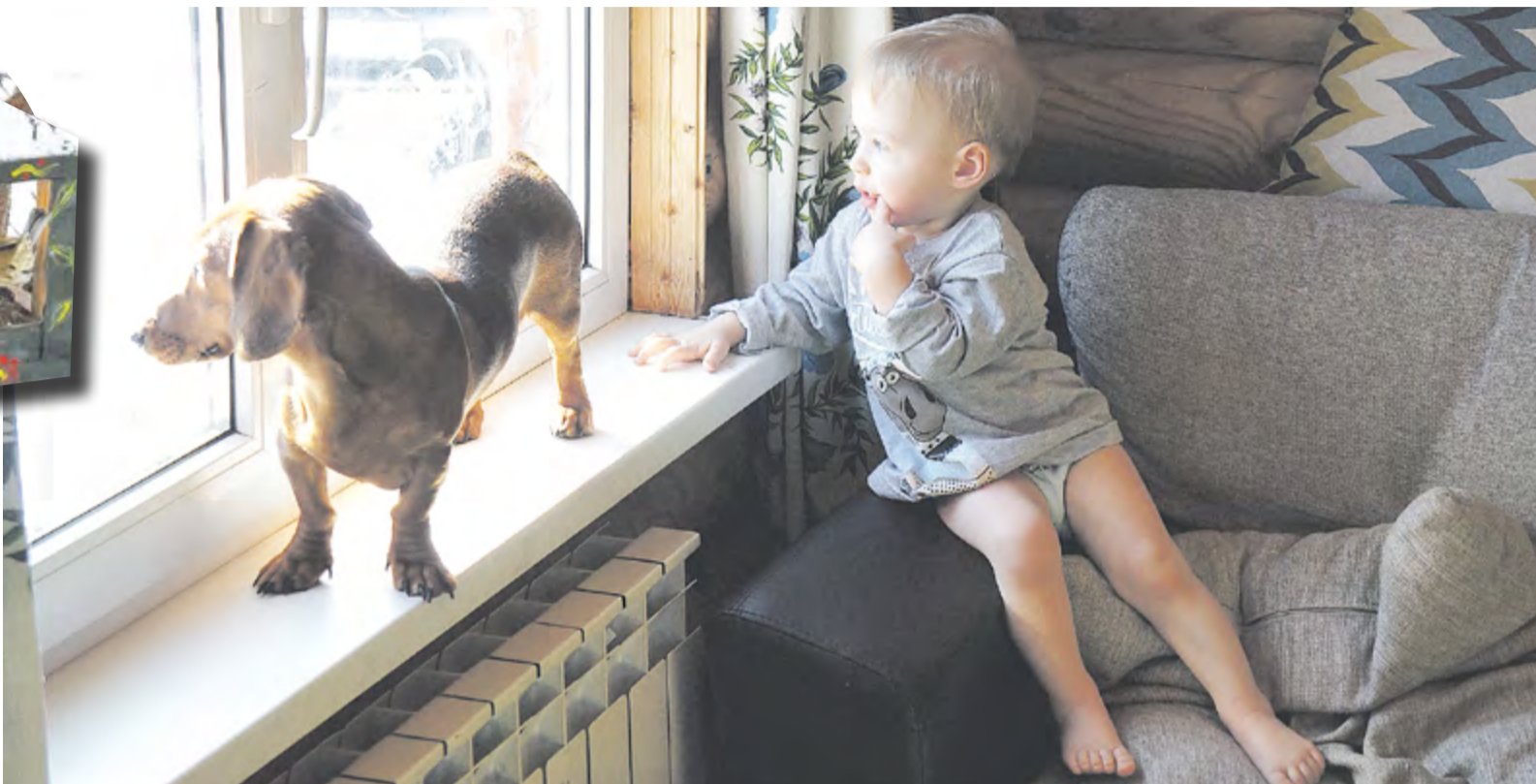
Младший сын подолгу наблюдает за птицами

УВЛЕЧЕНИЕ Вы сможете отличить чижа от зеленушки? А домового воробья от полевого? А самку дятла от самца? А кто такой кобчик, знаете? Мы – можем и знаем, потому что уже три года все эти птицы – всегдашними нашего двора. С ноября по апрель пернатые каждое утро навещают в кормушку, которая висит под нашим окном.