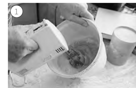
Яйца хорошо взбиваем с сахаром

Три яйца, стакан сахара, 250 граммов маргарина, 200 граммов творога или творожной массы, 0,5 стакана крахмала, 0,5 стакана изюма, апельсиновая цедра, чайная ложка соли, два стакана муки, уксус, чайная ложка соды.