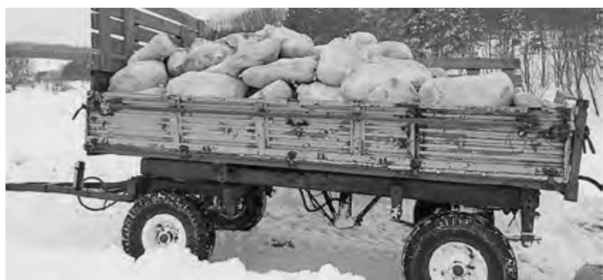
Прицеп с четырьмя тоннами контрабандного мяса

В феврале в Московском районе Харькова были обнаружены туши мёртвых свиной. В останках выявлен вирус африканской чумы свиней (АЧС). Кроме того, при проведении контрольных мероприятий на территории области у 11 особей диких кабанов из 85 был обнаружен возбудитель АЧС. Аналогичная ситуация с распространением вируса АЧС складывается и в Сумской области. И в то же время российские пограничники пресекли несколько попыток контрабанды мяса. В Валуйском районе, близ села Долгое, они задержали трактор Т-150 с прицепом, в котором было свинье четырех тонн мясной продукции – без маркировки и сопроводительных документов. Двое местных жителей везли этот груз из Украины.