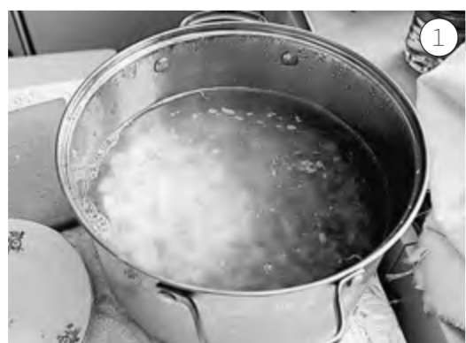
Отвариваем половину свёклы в трёх литрах воды, бульон охлаждаем. Варёную свёклу нарезаем длинными брусочками, обжариваем

Одна сахарная свёкла, корешок хрена, три картофелины в мундире, две моркови, луковичка, томатная паста, лимонная кислота либо свекольный квас.