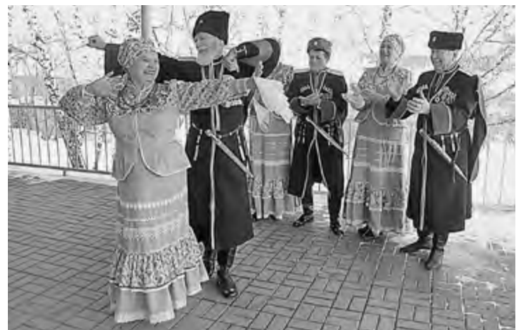
Терские казаки в Погромце

Почему в белгородском селе звучат песни терских казаков