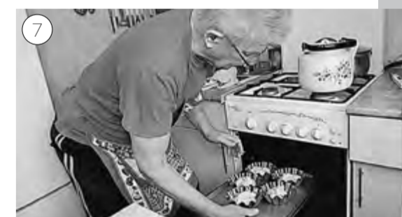
Печём в течение 40 минут при 180 градусах