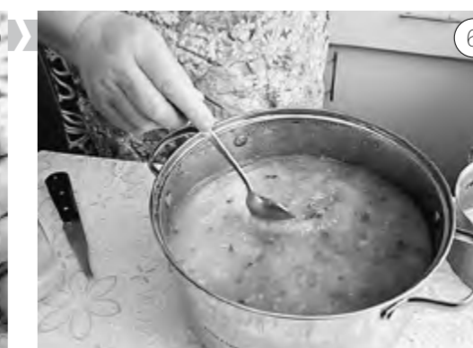
Все охлаждённые ингредиенты кладем в кастрюлю, добавляем лимонную кислоту либо свекольный квас, перемешиваем