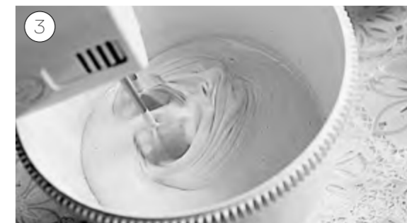
Добавляем размягчённый маргарин, взбиваем