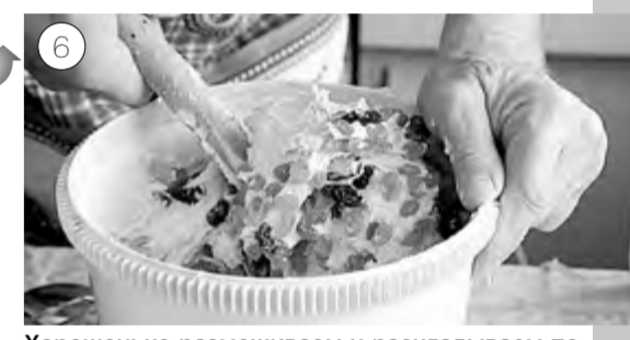
Хорошенько размешиваем и раскладываем по согретым в духовке смазанным формочкам