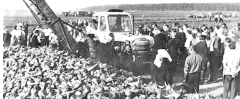
1975 год. Участники Всероссийского семинара по сахарной свёкле на поле колхоза «Россия» в селе Купино Шебекинского района

★ В ИВНЕ создано новое предприятие – «Транссельхозтехника».