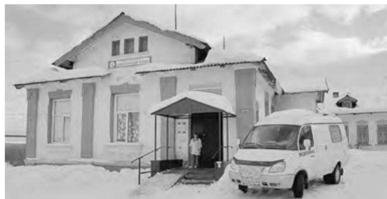
Новый офис семейного врача