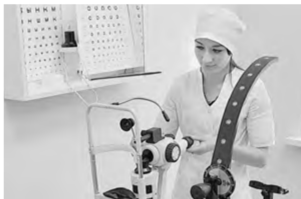
В офисе семейного врача