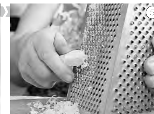
Трём корешок хрена