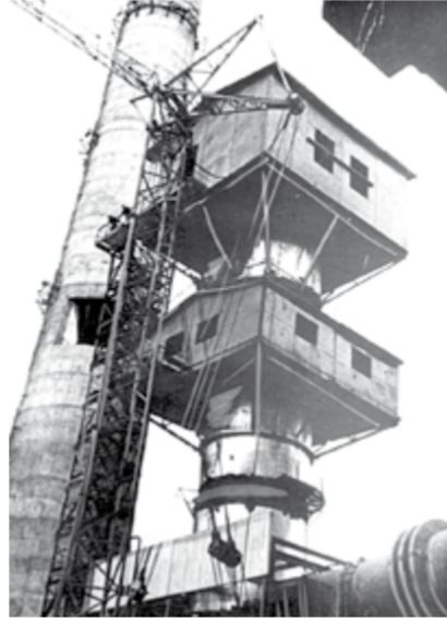
1975 год. Монтаж скрубера-капельноуловителя на Лебединском ГОКе