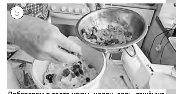
Добавляем в тесто изюм, цедру, соль, гашёную соду, крахмал, муку