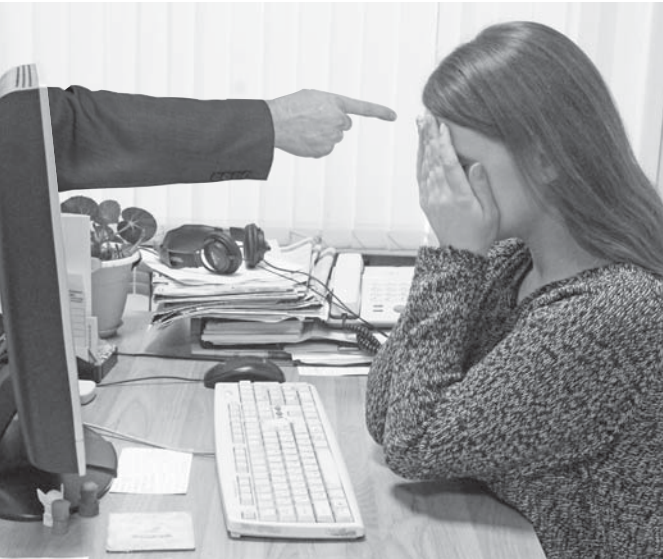
«Как прийти в себя и восстановить душевное равновесие, когда грязью в Сети облили вас?»

Я не знаю, что мне делать, куда ещё обращаться. Заявление написано, но такое ощущение, что полиция вообще ничего не делает. Участковый не отвечает, объяснений не даёт. Я уже боюсь всего: что узнают друзья и родствен-