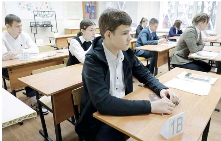
Школьникам из пригородов разрешат альтернативу сдачи экзаменов только в 2023 году