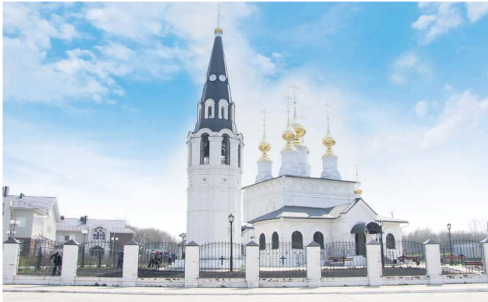
Храм Святого Димитрия, митрополитского Ростовского

Оксана ПРИДВОРЕВА, Вадим ЗАБЛОЦКИЙ (фото)