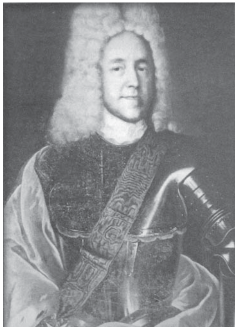
Первый губернатор Юрий Юрьевич Трубецкой