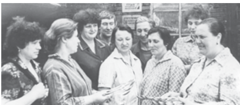
1986 год. Валуйки. Бригада цветного литья завода «Красный металлист», выполняющая дневные нормы на 125%, награждена орденом Трудовой Славы III степени