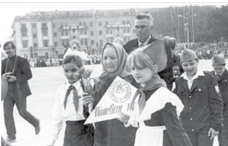
1986 год. На площади Революции в Белгороде