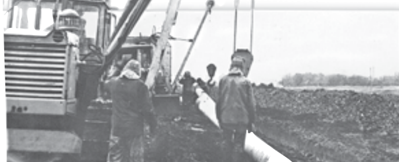
1986 год. Укладка труб газопровода Старый Оскол – Чернянка. Работы ведёт старооскольское СМУ треста «Белгородгазстрой»

★26 ЯНВАРЯ по итогам Всесоюзного соревнования за успешное выполнение государственного плана экономического и социального развития СССР на 1985 год и заданий одиннадцатой пятилетки признан победителем и награжден переходящим Красным знаменем ЦК КПСС, Совета Министров СССР, ВЦСПС и ЦК ВЛКСМ коллектив Белгородской слюдяной фабрики. А коллективы Белгородского производственного объединения молочной промышленности и специализированного треста «КМАстроймеханизация» (Белгород) награждены переходящими Красными знаменами и памятными знаками ЦК КПСС, Совета Министров СССР, ВЦСПС и ЦК ВЛКСМ «за высокую эффективность и качество работы в одиннадцатой пятилетке» с занесением на Всесоюзную Доску почёта на ВДНХ СССР.