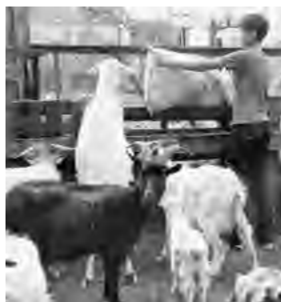
Дети приучены к труду: работают на огороде и ухаживают за козами

ной городской больницы оценил тяжесть ситуации и солдата сразу отвезли в военный госпиталь имени А.А. Вишневского.