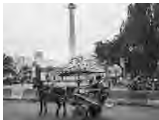
Национальный памятник «Монас» на площади Мердека в Джакарте.

Согласно экспертизам, создан гобелен на территории современной Бельгии. Его реставрация заняла полтора года. Специалистам удалось «оживить» краски потускневшей со временем картины.