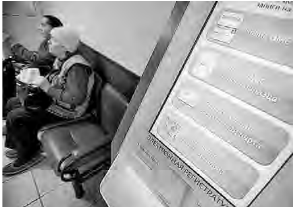
По единому полису можно получить медицинскую помощь в любом регионе страны

Проще говоря, за повышение тарифов (когда по факту была оказана