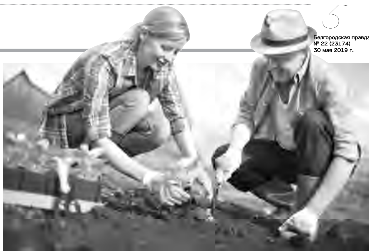
Скоро подкармливать подросшие овощи, а химию применять ой как не хочется

Приготовьтесь, что залитая водой травяная каша начнёт бродить, поэтому не нужно закручивать её намертво винтовой крышкой – просто прикройте деревяшкой или мешком. Некоторые советуют для ускорения процесса брожения и снижения запаха добавлять в настой препараты с живыми бактериями или органическую кислоту (типа сыворотки). Запах действительно потеряет резкость, потому что в составе увеличится количество молочной кислоты, но вообще начнется несколько иной процесс разложения, напоминающий производство силоса. Но, как считают специалисты, кислая среда значи-