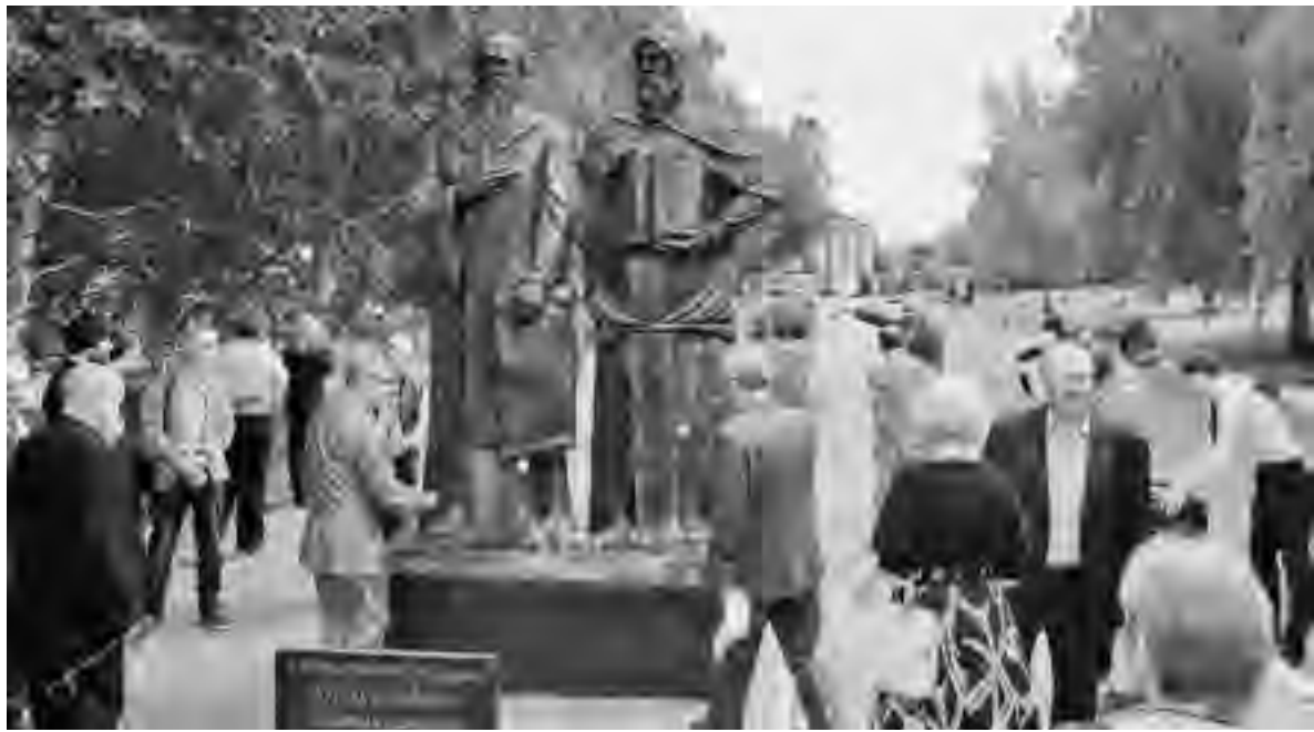
Цветы к памятнику создателям славянской письменности

Белорусский язык отличается тем, что привычные нам русские слова пишутся ближе к тому, как они слышатся. В аэропорту Минска на информационном табло пассажиров встречает надпись «Прыльеты». А в расписании рей-