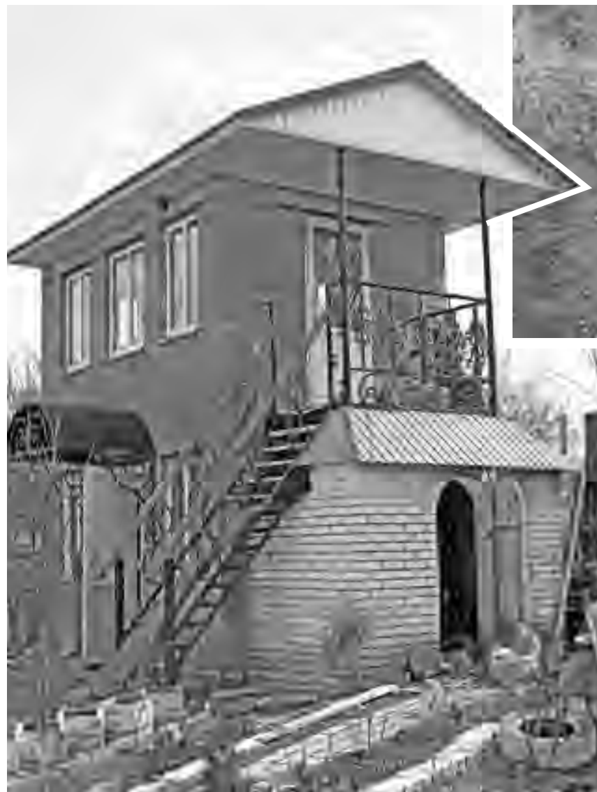
В усадьбе всё благоустроено