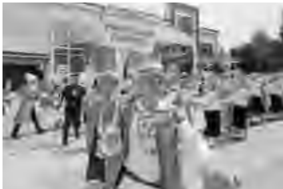
Весело белорусам в едином славянском хороводе