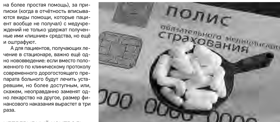
С медиков будут строже спрашивать и за приписки, и за нерационально назначенные лекарства

Эта статья является комментарием к Приказу Министерства здравоохранения Российской Федерации (Минздрав России) от 28 февраля 2019 г. № 108н г. Москва «Об утверждении Правил обязательного медицинского страхования»