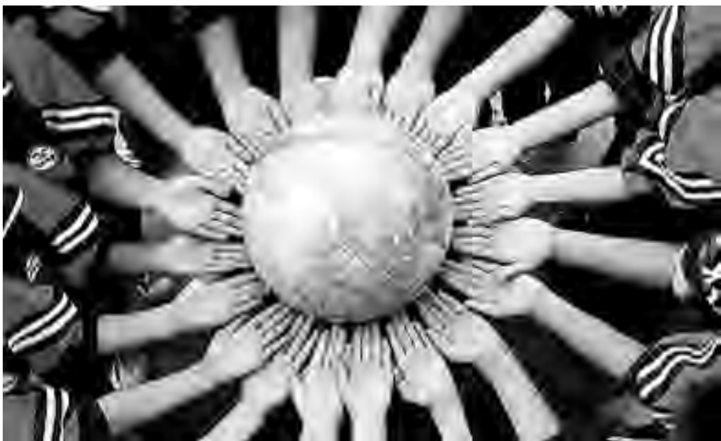
Цель предмета «география» не в зубрёжке понятий, а в том, чтобы понимать ключевые законы, по которым живёт наша планета

При этом, невзирая на все нарушения и негативную репутацию МФО, идею их запрета Центробанк не поддерживает – иначе россияне начнут обращаться к нелегальным кредиторам, заявила председатель ЦБ Эльвира Набиуллина.