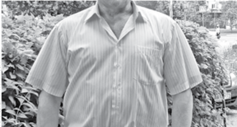
ФОТО ВЕРИТИКИ ФИЛИППОВА

– Лов на нерестовых участках, использование различных сетей и ловушек, превышение количества улова. Мы задерживаем незакон-