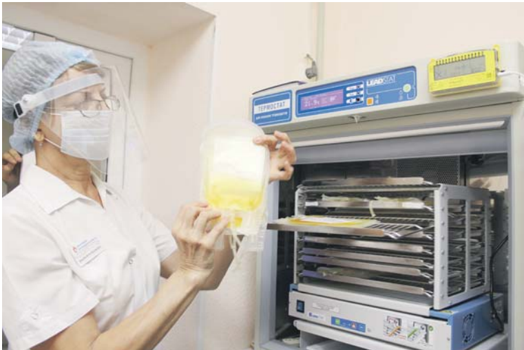
Кровь каждого донора тестируют на антигенах

ЕЖЕДНЕВНО КРОВЬ ПРИХОДЯТ СДАВАТЬ ОКОЛО 100 ЧЕЛОВЕК. В МАРТЕ — АПРЕЛЕ АНТИТЕЛА НАХОДИЛИ У 20–30% ДОНОРОВ. СЕЙЧАС — У 40–50%, И У МНОГИХ ИЗ НИХ АНТИТЕЛА ПОЯВИЛИСЬ ПОСЛЕ ПРИВИВКИ.