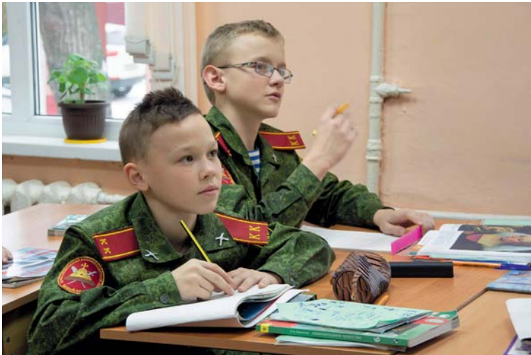
Кадетские классы не только позволяют детям быть ближе к преподавателям