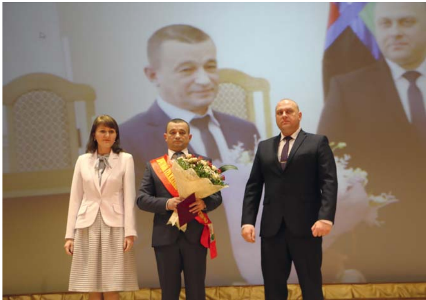
Юбилейный год ракитанцы проводят в пассажи и плавсажи >