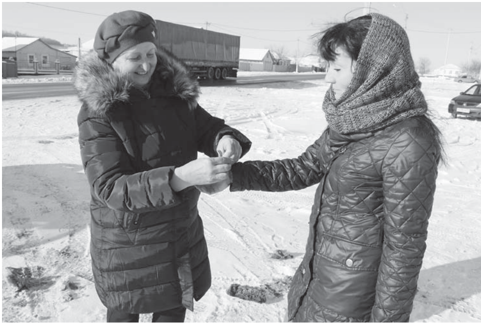
АРХИВ НОВОАЛЕКСАНДРОВСКОГО ДЕТСАДА