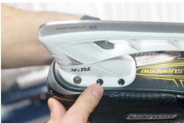
Тщательно проверьте застёжки

Коньки бывают хоккейными, фигурными и прогулочными. Это основные типы, хотя для каждого вида спорта существуют свои нюансы — о них вам расскажет тренер. А для отдыха подойдут обычные прогулочные коньки.