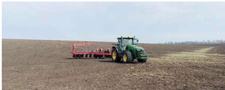
Аграрии планируют засеять 800 га подсолнечника