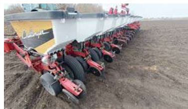
Для сельхозработ используют 16-рядную сеялку