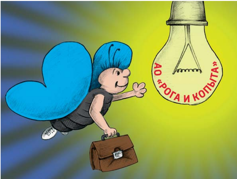
Сомнительные преимущества для подставного директора заканчиваются очень быстро

Новая точка на карте телепроекта «Сельский парадокс» — село Почаево Грайворонского городского округа. Как и в прежние времена, здесь можно почаеваться — угоститься чаем. А ещё — отведать местного мёда, побывать на экскурсиях по пасеке и оценить новый спектакль любительского театра нукол, которому уже более 20 лет. Путешествие в Почаево вместе с «Миром Белогорья» — в среду, 16 января, в 15.20, 16.20, 19.00 и 20.10 в эфире первого областного. В любое удобное время телеочерк можно посмотреть на сайте mirbelogorya.ru и в группах «Мира Белогорья» в социальных сетях «ВКонтакте» и «Одноклассники».